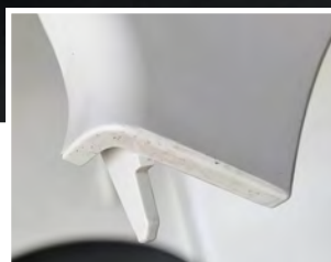
VOR DER REINIGUNG: Verunreinigte Teile durch Rückstände in der Form