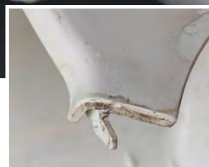
WÄHREND DER REINIGUNG: Aus der Form ausgetragene schwer verunreinigte Teile nach Anwendung von Lusin® MC1718