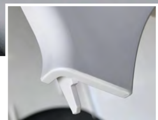
NACH DER REINIGUNG: Teile nach der Formenreinigung mit Lusin® MC1718